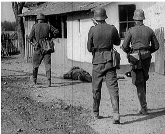
KRIEG IN GRIECHENLAND, D 1941