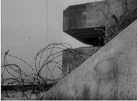
[DEUTSCHE KÜSTENBEFESTIGUNGEN], D 1943