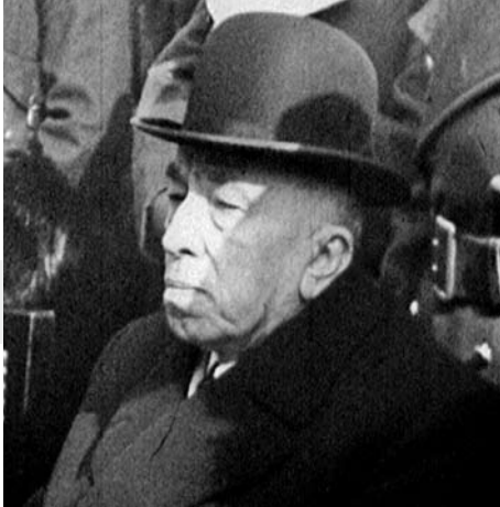
JAHRESTAG DER ERRICHTUNG DES REICHSPROTEKTORATES BÖHMEN UND MÄHREN, D 1941