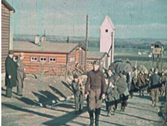
Kriegsgefangenenlager Kaisersteinbruch, A 1940