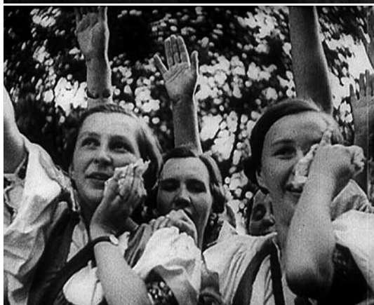
DER FÜHRER IN BAYREUTH, A 1938