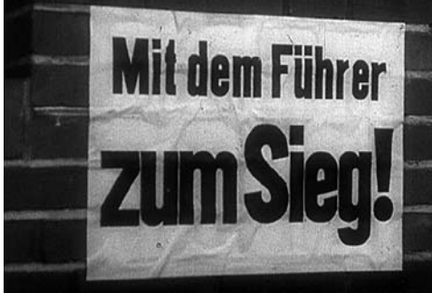
MINISTER GOEBBELS IN EINEM KÖLNER RÜSTUNGSWERK, D 1944

erwarteten »zweiten Front« – der Invasion in der Normandie (vgl. 9.3) am 6. Juni 1944 – absehbar.