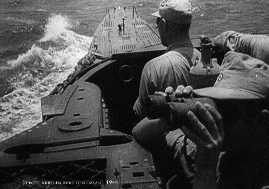
[U-BOOT-KRIEG IM INDISCHEN OZEAN], 1944