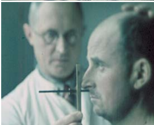
RASSENKUNDLICHE UNTERSUCHUNGEN AN GEFANGENEN FRANZOSEN UND BELGIERN IM KRIEGSGEFANGENENLAGER KAISERSTEINBRUCH, A 1940