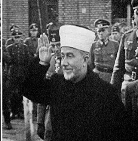
DER GROSSMUFTI VON JERUSALEM BESUCHT DIE SS-DIVISION »HANDSCHAR«, HR 1944