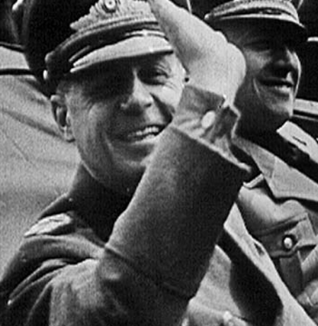
POLITISCHER UND MILITÄRISCHER PAKT DEUTSCHLAND – ITALIEN, A 1939