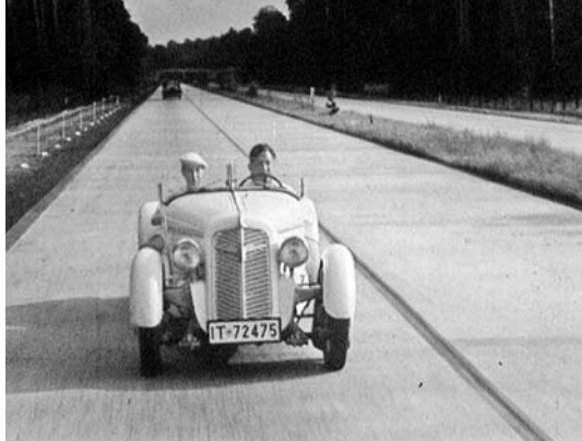
BESUCH IN FRANKFURT AM MAIN, D 1937