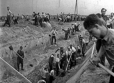
[SCHANZARBEITEN ZUR BEFESTIGUNG DER OSTGRENZE], D 1944