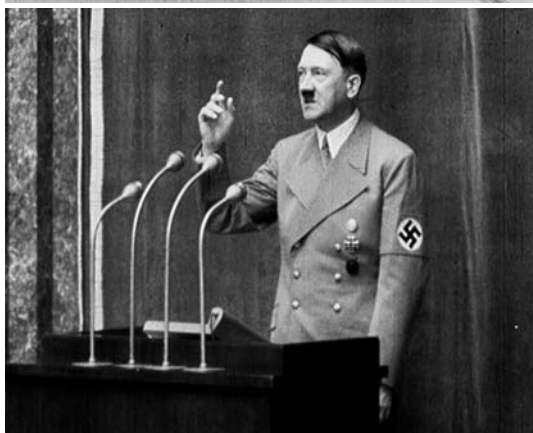
DER FÜHRER ERÖFFNET DEN TAG DER DEUTSCHEN KUNST IN MÜNCHEN, A 1938