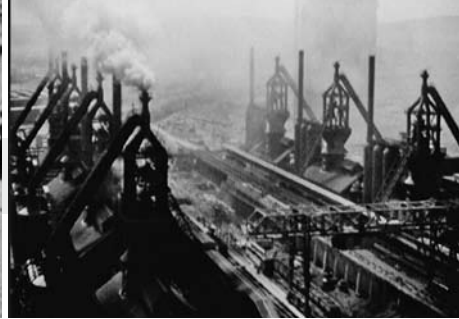
DIE HERMANN-GÖRING-WERKE BAUEN, D 1942