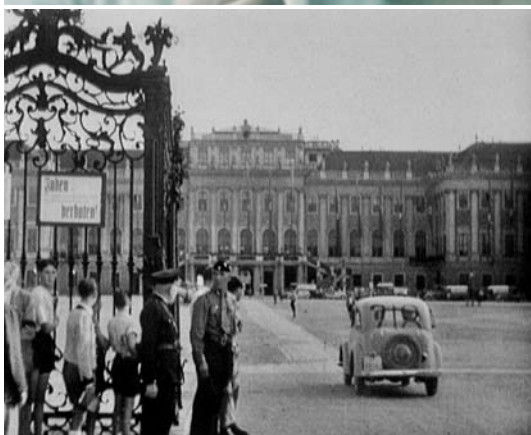
DIE NSKK-ALPENFAHRT 1938, A 1938