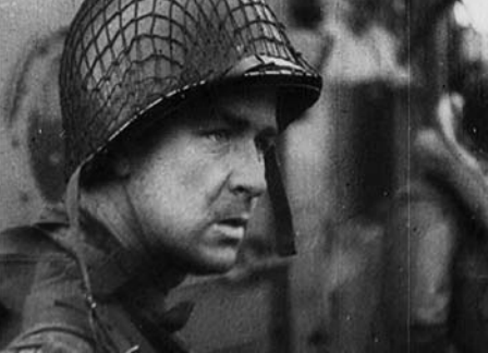
INVASION. VOM ATLANTIKWALL BIS PARIS, GB 1946