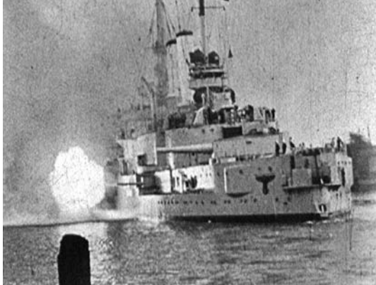
BEGINN DES FELDZUGES GEGEN POLEN, D 1939