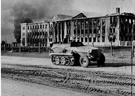
[KÄMPFE IN DEN VORSTÄDTEN VON STALINGRAD], D 1942

Der Name Stalingrad wurde zum Synonym für die Kriegswende. Die vorliegenden Filmaufnahmen geben nur eine schwache Ahnung von den schweren Kämpfen in dieser Stadt. Die Kapitulation der deutschen 6. Armee im Kessel von Stalingrad markiert das Ende der deutschen Expansionsbewegung im Zweiten Weltkrieg.