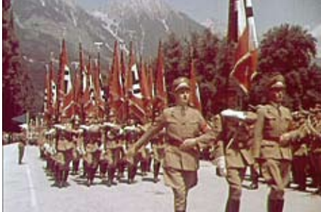
LANDESSCHIESSEN 1943 IN INNSBRUCK, A 1943