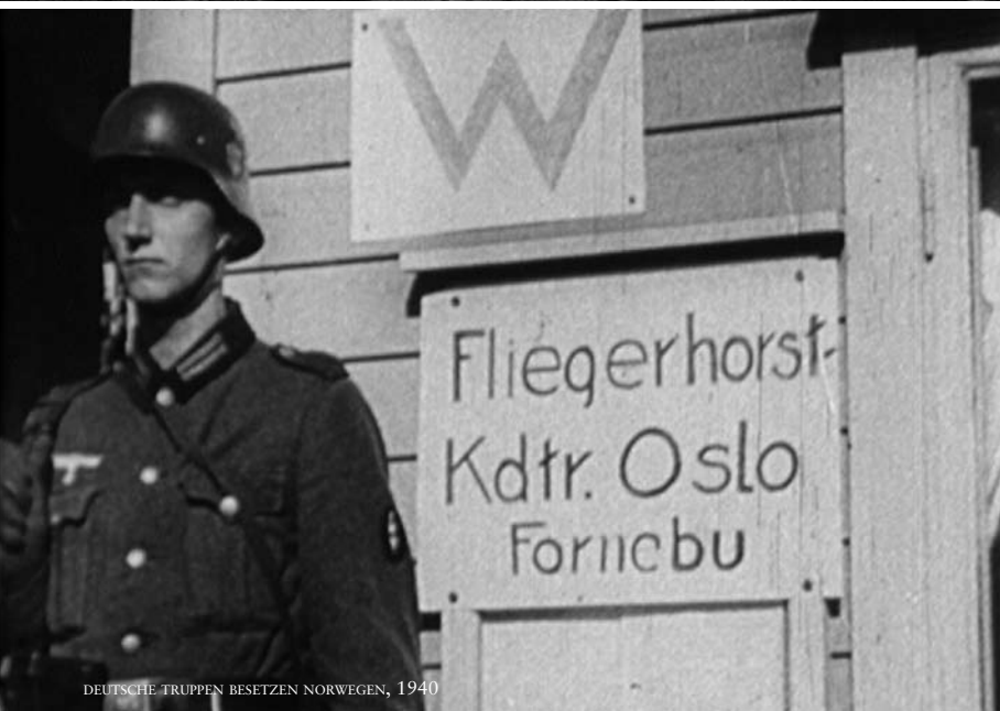
DEUTSCHE TRUPPEN BESETZEN NORWEGEN, 1940