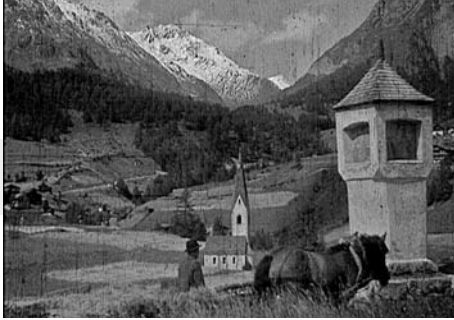
AUTARKIE IM BERGDORF, A 1939

Preis- und Lohnregulierungen gehörten zu diesem System, aber auch aufgeblähte Bürokratien wie die der »Deutschen Arbeitsfront«. Sie erfüllten Kontrollfunktionen und ließen wenig Platz für individuelle Freiheiten oder spezifische Interessen der Beschäftigten. Solange die Wohlfahrtsmaßnahmen Wirkung zeigten, sah die »Volksgemeinschaft« über derartige Nachteile aber ebenso hinweg wie über die Ausbeutung und Ausrottung der »Fremdarbeiter«, die zu fixen Größen der NS-Bilanzbuchhaltung wurden. Ein ökonomischer und technisch-organisatorischer Strukturwandel vollzog sich zugunsten der Produktionskonzentration. Dabei spielten die Verbrechen des Regimes eine wichtige Rolle: Die »Arisierung« von rund 33.000 jüdischen Mittel- und Kleinbetrieben trug ebenso zur Schaffung von Großunternehmen bei wie die Erfordernisse der Kriegswirtschaft. Bis 1945 wurden immer mehr ausländische Zwangsarbeiter, Kriegsgefangene und KZ-Häftlinge eingesetzt. Die »regressive Modernisierung« des NS-Systems basierte nicht zuletzt auf Sklavenarbeit.