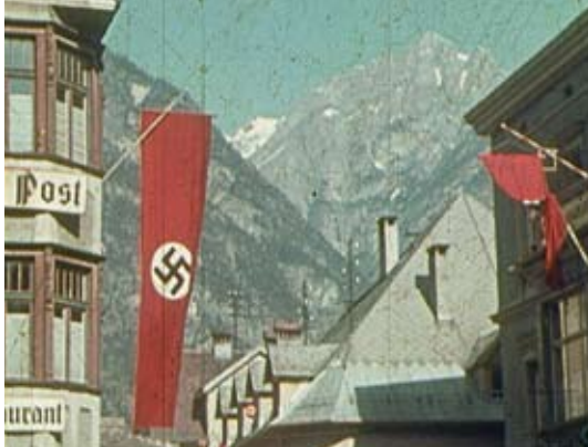
LANDECK IM FAHNENSCHMUCK, A 1938