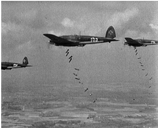
LUFTANGRIFF AUF ENGLAND, D 1940