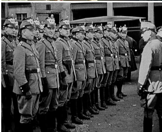
POLIZEI-JAHRESSCHAU 1938, A 1938