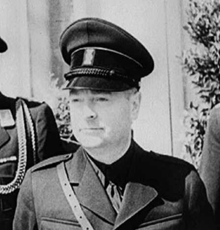
UTRECHT. AUFMARSCH DER NSB, D 1941