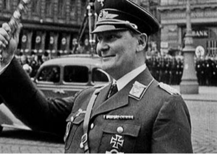
ANKUNFT DES GENERALFELDMARSCHALLS HERMANN GÖRING IN WIEN, A 1938