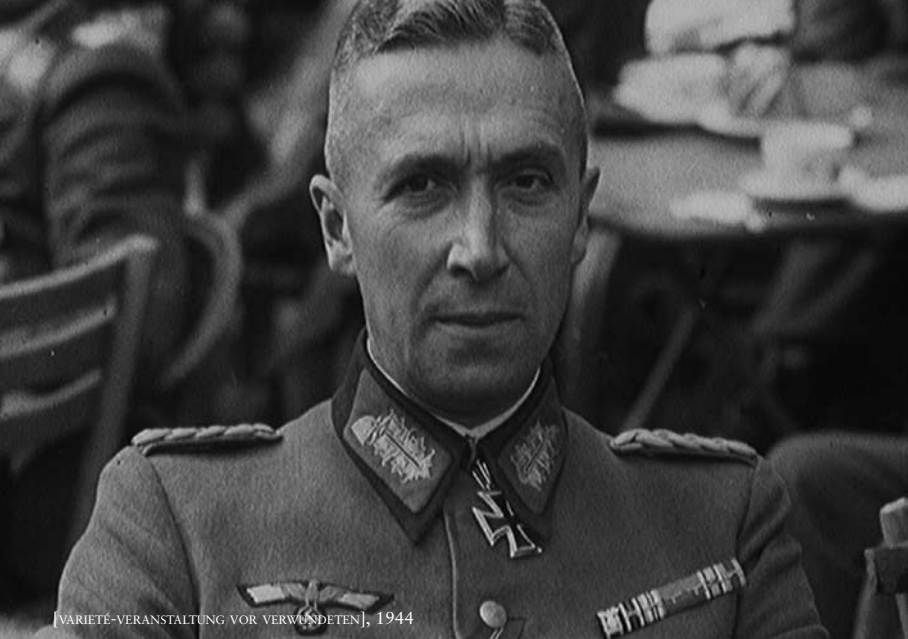
[VARIÉTÉ-VERANSTALTUNG VOR VERWUNDETEN], 1944

Eineiige Zwillinge. Schwachsinnig. Vater Betrüger. Mutter nervös und Trinkerin