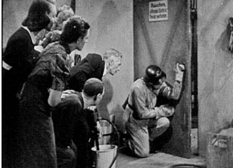
WAS JEDER WISSEN MUSS!, D ca. 1941